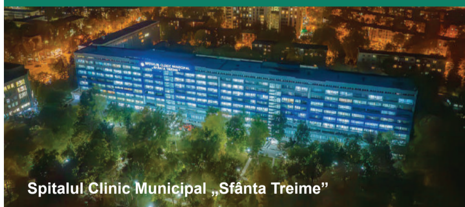
Spitalul Clinic Municipal „Sfânta Treime”