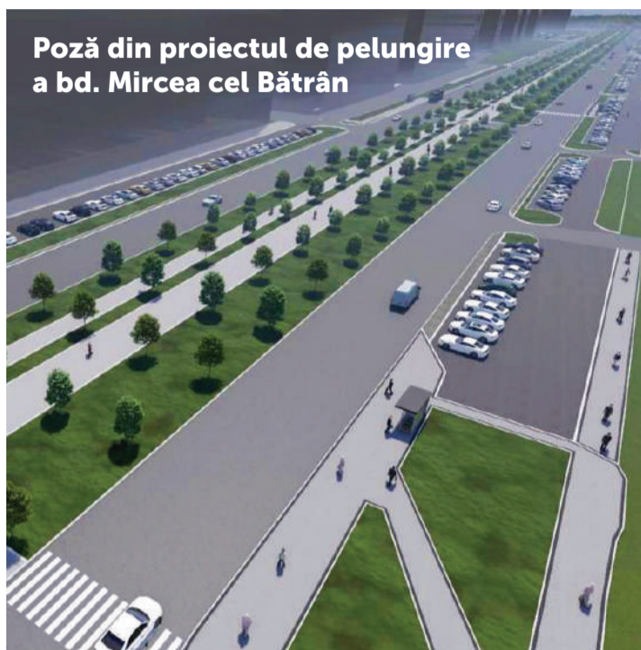
Poză din proiectul de pelungire a bd. Mircea cel Bătrîn

Mereu am pledat pentru valorificarea potențialului și crearea zonelor noi la periferiile orașului. Recent, am finalizat proiectarea străzilor și viziunile de dezvoltare pentru regiunile mari ale Capitalei. Ne propunem extinderea Chișinăului, iar pentru asta sunt pregătite Proiecte mari pe zone precum Mesager, Industrială, Mircea cel Bătrîn.