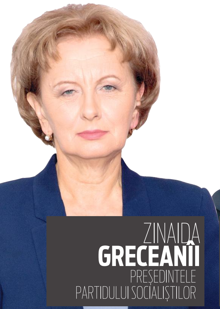
ZINAIDA GRECEANII PREȘEDINTELE PARTIDULUI SOCIALIȘTILOR