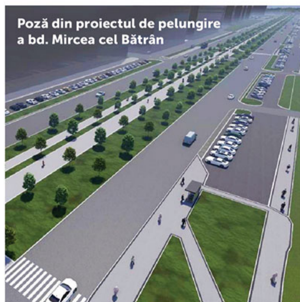
Poză din proiectul de pelungire a bd. Mircea cel Bătrîn

Mereu am pledat pentru valorificarea potențialului și crearea zonelor noi la periferiile orașului. Recent, am finalizat proiectarea străzilor și viziunile de dezvoltare pentru regiunile mari ale Capitalei. Ne propunem extinderea Chișinăului, iar pentru asta sunt pregătite Proiecte mari pe zone precum Mesager, Industrială, Mircea cel Bătrîn.