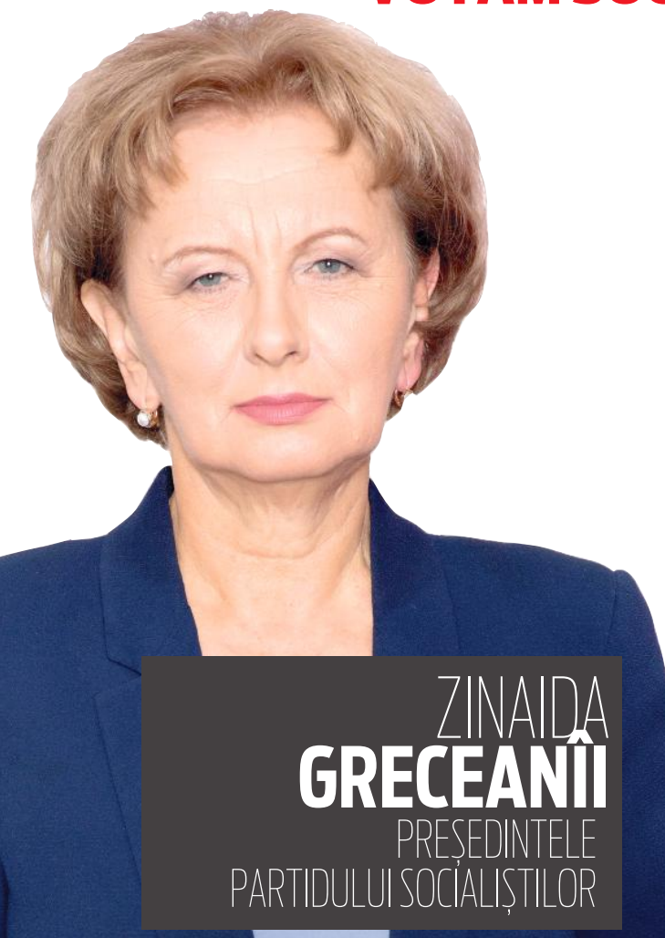
ZINAIDA GRECEANII PREȘEDINTELE PARTIDULUI SOCIALIȘTILOR