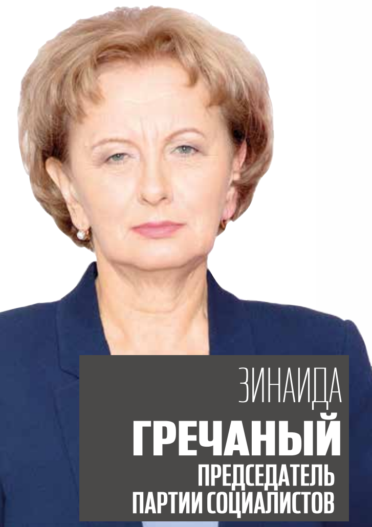
ЗИНАИДА ГРЕЧАНЫЙ ПРЕДСЕДАТЕЛЬ ПАРТИИ СОЦИАЛИСТОВ